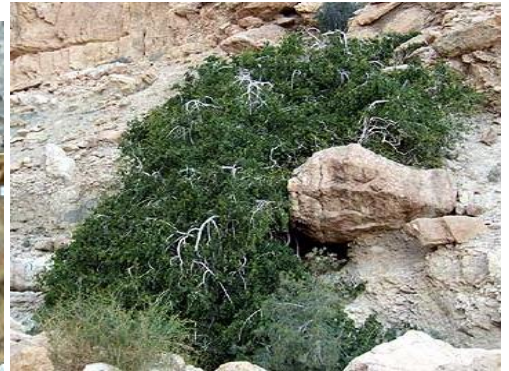
הסלבדורה של נחל הסלבדורה

יציאה בשעה 06:30 מנאות הכיכר, 07:00 מנווה זוהר (אפשר להשאיר שם רכב). 07:30 מעין גדי (נא להודיע היכן מצטרפים). צירוף ילדים : בדרך כלל מוכח שהיכולות שלהם תלויות יותר באופי ובהרגלים ולא רק בגיל. לא פעם מתברר שיש לילדים פחות קשיים מאשר למבוגרים. ההחלטה היא כמובן של ההורים ועליהם גם האחריות על הילדים והתנהגותם בזמן הטיול ובכל מקרה, הרגישו חופשי גם להתייעץ איתי בטלפון.